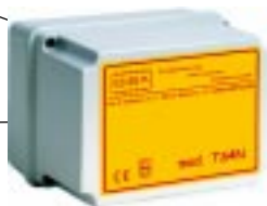
ALIMENTATORE MOD.TS4N 220V